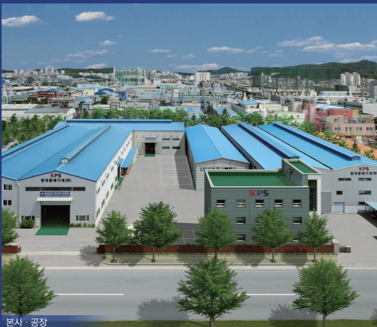
본사 · 공장